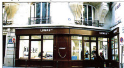
LUMAS PARIS - SAINT-GERMAIN

Quindici indirizzi tedeschi: Aachen, Berlino (per tre), Bremen, Bielefeld, Dortmund, Düsseldorf, Francoforte, Hamburg, Heidelberg, Colonia, Monaco, Münster e Stoccarda. Cinque indirizzi europei: Londra, Vienna, Parigi (per due) e Zurigo. Due indirizzi a New York City.